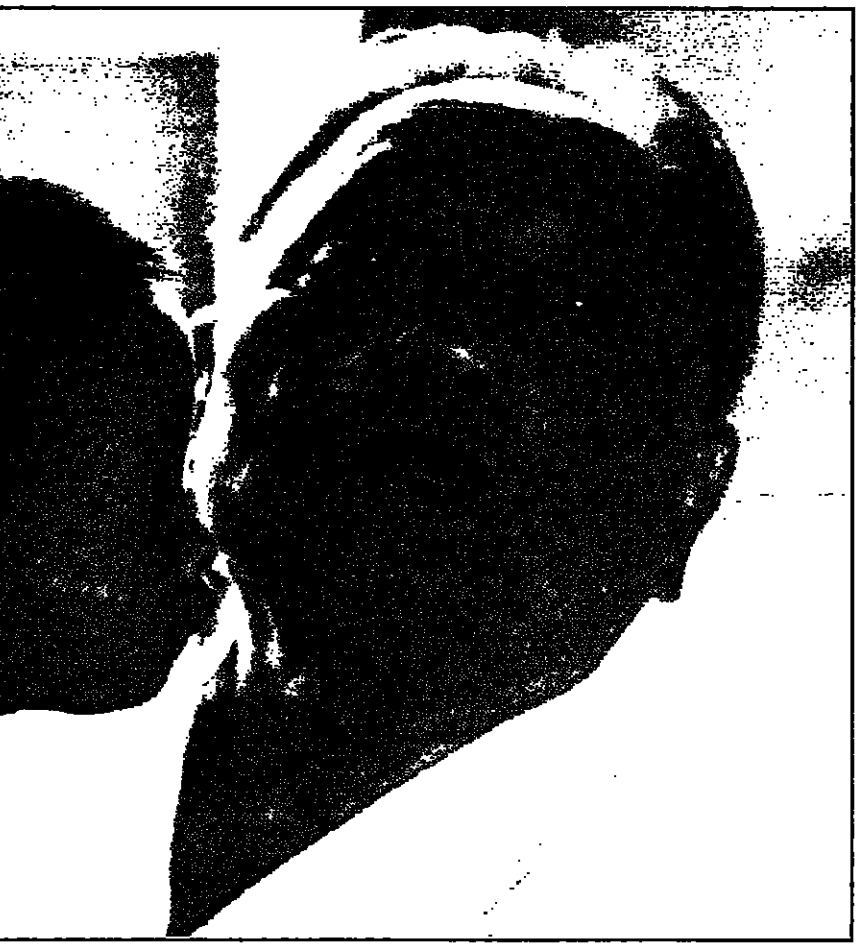
الزعيم الصيني دينغ شياو بينغ في صورة من صورة في عيد ميلاده عام 1986

بيكين-رويتزر: أعلنت وكالة انباء شينخوا الصينية مساء امس وفاة الزعيم الصيني الكبير دينغ شياو بينغ. وقالوا انهم يشككون في جدية معارضتها لابرام تسوية سلمية.